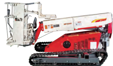
全長はクラス最短 2,475mm

上下3.4m、左右3.5mの広い作業範囲。伸縮式ブームで下枝をかわす作業もスムーズに。ブームを縮めるとコンパクトに格納。