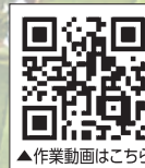
▲作業動画はこちら