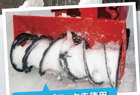
スノーブロック未使用