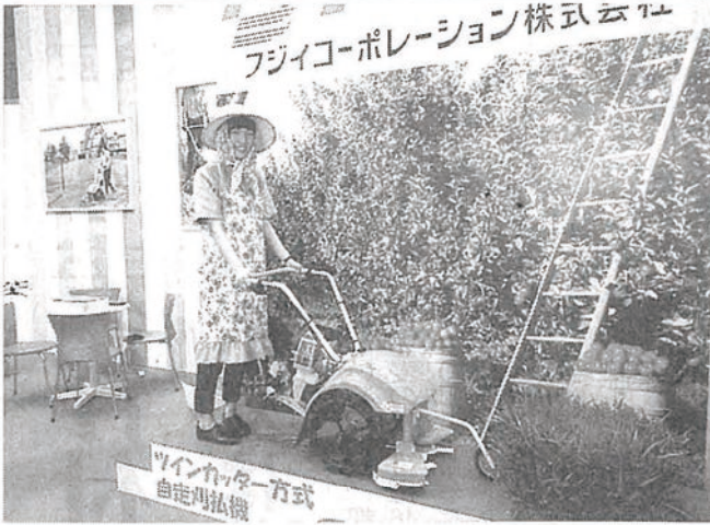
道工具EXPOで初披露された

【主な特長】①安全作業 刈取部が前方にあり、作業者との距離が保たれる。②簡単操作 右のハンドル刈取レバーと左の走行レバーを同時に握ると刈取りスタート。レバーを離せば止まるデッドマンロックを採用し安全性にも配慮③独自のツインカッター方式 一对の刈刃が回転し「刈る」「払う」「集める」排出の一々4役をこなす。刈り取った草は、中央に集められ、後方に搬送、排出。草の停滞や攪拌による馬力ロスがなく、効能率の作業が可能④刈り高さハンドル調整可能 作業スタイルに応じて、刈り高さハンドル高さを調整⑤ハンドル調整可能 作業場所に応じて、車輪間隔を調整が可能⑥豊富なアタッチメント 2ターボ・丈の長い草、飛散低減に有効。ホイールカバー・側面・後方への飛散を低減。フロント防塵カバー・前方からの飛散を低減。排出フィン・草の排出性アップに有効。