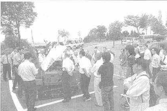
販売店会議では大型の新型除雪機も披露した

有力ディーラー26社を招き「2018フジイ5DK-z」が発売された。同製品は、昨年発売した大型旗艦機種種の除雪機SQタイプに35馬力モデルを追加したものである。【特長】①トルクフルなディーゼルエンジン347馬力を搭載、フルパワーでの連続作業を可能にし、投雪距離・低温始動性が大きく向上②狙った場所に雪をまとめて飛ばすロックオンプラス機能③投雪方向に加え、投雪距離も自動制御。狙った場所に雪をまとめられるので、排雪時にトラックの荷台に雪を載せる場合等に効果を発揮④簡単に平らに除雪、スノーマチックプラス機能⑤左右方向プラス前後方向の傾斜を感知する2軸型傾斜センサを標準装備。機体の傾き