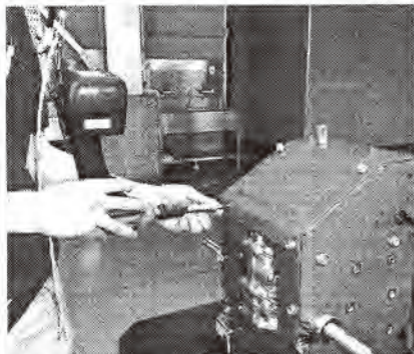
更新した最新型インパクトでの作業の様子