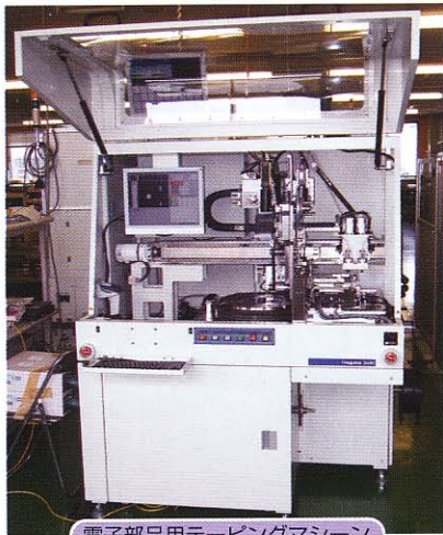
電子部品用テーピングマシン