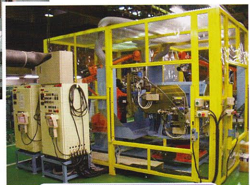
ドアサッシの溶接ビード研磨ロボット