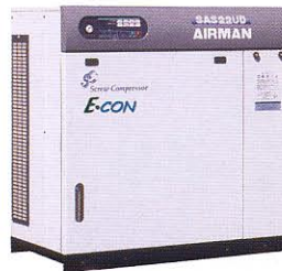
エアコンプレッサー