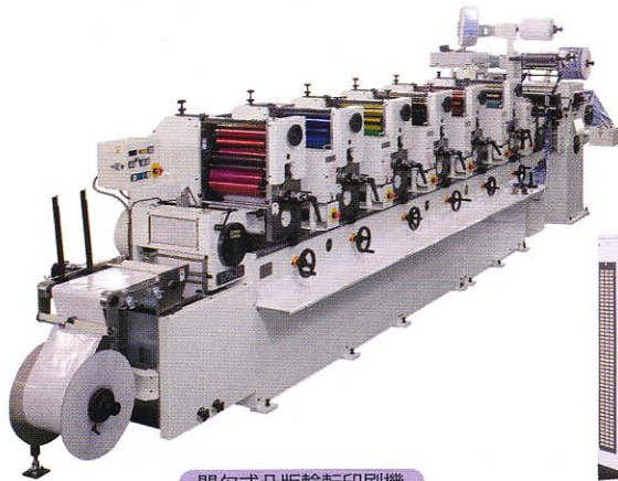
間欠式凸版輪転印刷機