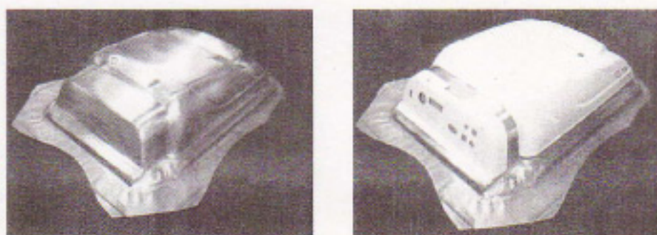
写真3 除雪機のトップカバーと操作パネルのセット成形

ドロミテ成形法の開発初期において、実験的に行ったセット成形部品の例である。従来より用い