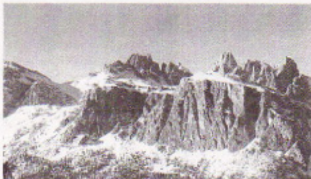
写真1 ドロミテ山塊

ス加工の推進＝金型レスで絞り部品をプレス加工する」が、ドロミテ成形法の開発に大きく影響を与えたことは間違いない。ただ、実現への確たる根拠は当時まだ何もない状態であった。